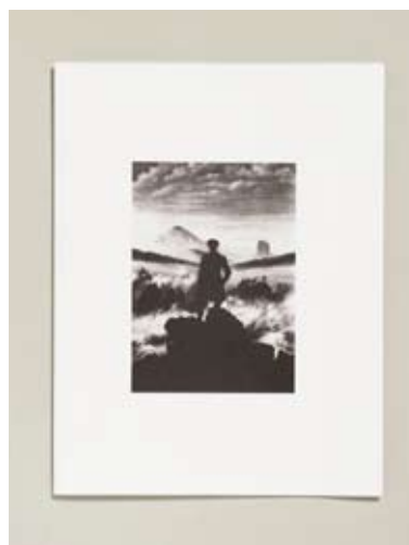
Titre Projet pour un château Titel Artiste Olivier Foulon Kunstenaar Editeur Gevaert Editions Uitgever Imprimeur Tuerlinckx Drukker