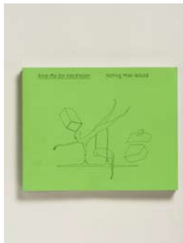
Titre Annemie Van Kerckhoven Titel Graphiste Sara De Bondt Grafici Editeur Kunst Museum Luzern, Wiels CAC - CHK Uitgever Imprimeur Die Keure Drukker