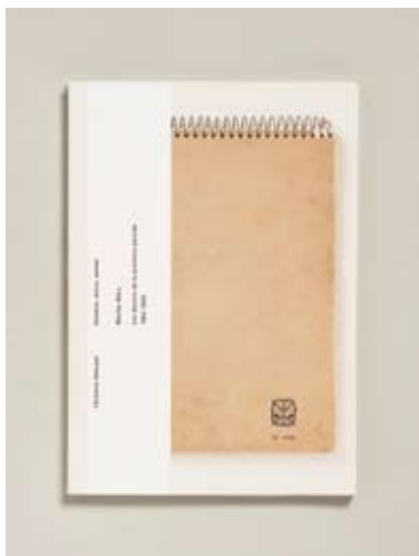
Titre Dessiner, écrire, penser - Marthe Wéry Titel Graphiste SalutPublic Grafici Editeur couper ou pas couper Uitgever Imprimeur Sintjoris Drukker