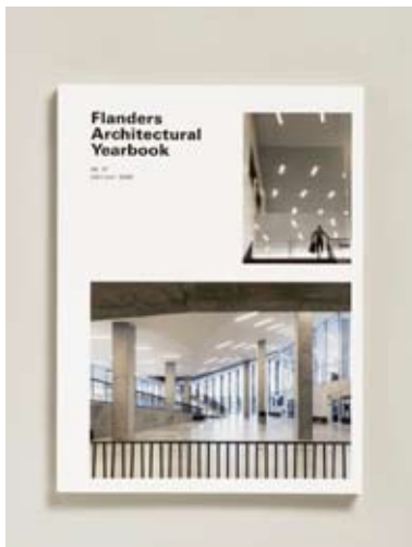
Titre Flanders Architectural Yearbook 06 07 Titel Graphistes Michaël Bussaer & Inge Ketelers Grafici Editeur Vai Antwerpen Uitgever Imprimeur Die Keure Drukker