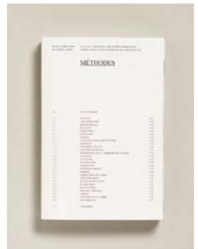
Titre Méthodes Titel Graphiste Manuela Dechamps Grafici Editeur Otamendi Uitgever Galerie d'Architecture / Commissariat général aux affaires internationales (Wallonie-Bruxelles International) / Ministère de la communauté française de Belgique / Centre Wallonie Bruxelles à Paris Imprimeur Snell Graphics Drukker